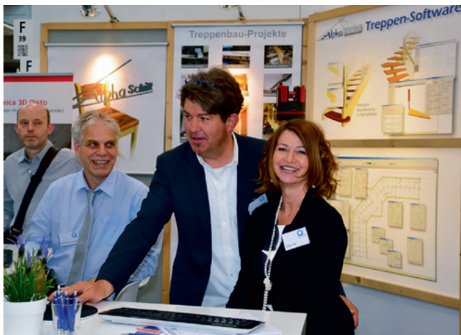
Die Firma Alpha-Software präsentierte auf der Ligna 2015 wieder interessante Neuheiten der Programme AlphaSchift und AlphaStairs.